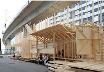
Operación simple: reinvención temporal de espacios indefinidos (ej. debajo de puentes). ALICE, Counter City, Zurich 2017