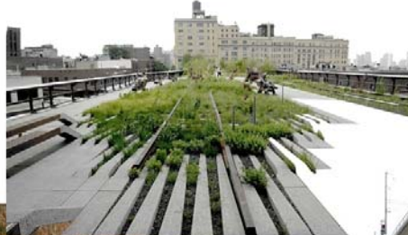
Operación compleja: reinvención de infraestructura en desuso (ej. líneas férreas). Field Operations & Diller Scofidio + Renfro, High Line, New York 2009