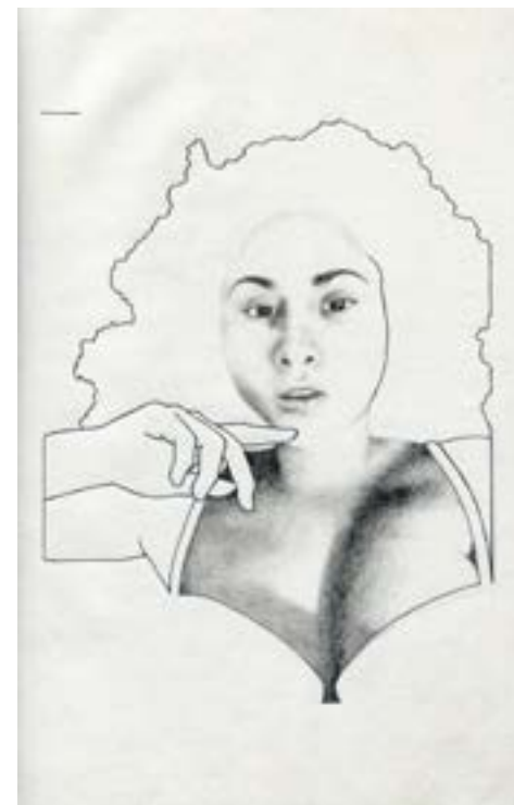
Título: Modelo A5 #2 Técnica: Grafito sobre papel Formato: Dibujo Dimensiones: 15x21 cm Año: 2018