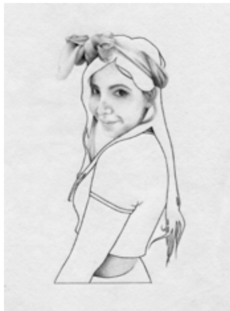
Título: Modelo A5 #8 Técnica: Grafito sobre papel Formato: Dibujo Dimensiones: 15x21 cm Año: 2019