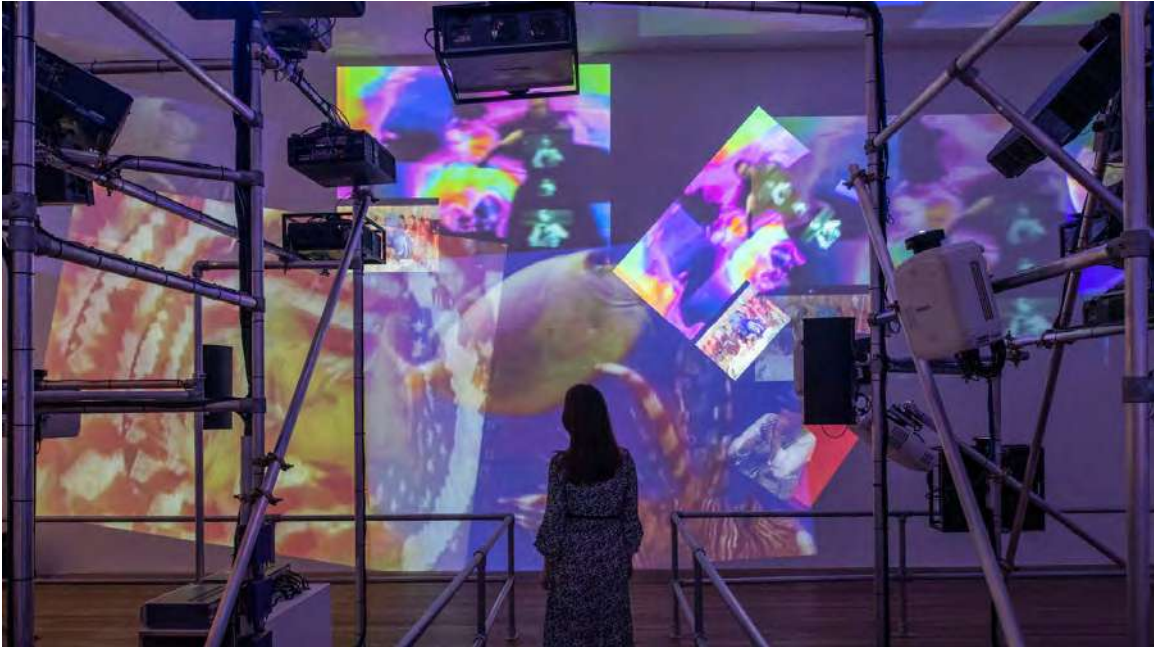
“Sistine Chapel” Nam June Paik/ Tate Modern

La práctica busca definir criterios curatoriales para organizar registros de obras o producciones en distintas disciplinas desde una perspectiva de su valor cultural. Está dirigida a estudiantes de todas las carreras que les interese desarrollar herramientas de registro (fotográfico/video/sonido) y comunicación de proyectos a través de diversos medios y técnicas. Se trabajará en la elaboración de un archivo, proyecto de exhibición y una cuenta de Instagram . De esta forma, la práctica pretende diversificar los medios de difusión, análisis y exhibición de los proyectos de estudiantes y la comunidad universitaria en general.