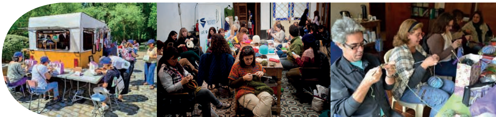
Imágenes: Iniciativas de triple impacto textil (España y Argentina)

En colaboración con la Municipalidad de Zapallar y la Fundación Cultural de Santiago realizaremos las gestiones, reconocimiento y desarrollo de diseño correspondiente, para poder preparar los talleres, antes de llevarlos a cabo en el mes de Noviembre con los distintos vecinas y vecinos de dichos municipios.